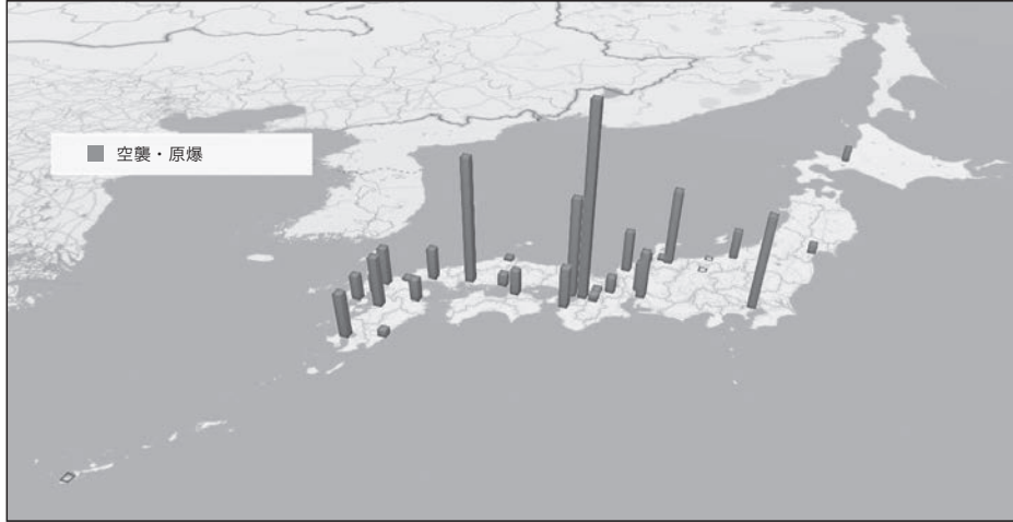
資料2 「空襲・原爆被害」地図

ることが、今後の主要課題のひとつです。 ここでは、どの地域に空襲や原爆被害が多かったのかが一目瞭然です。