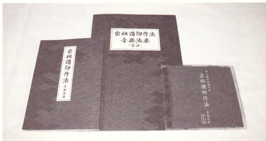
左から経本、楽譜、練習用CD

その結果、『宗祖讃仰作法 第三種』は、いわゆる音楽法要としてご制定に至りましたが、その完成までには、いくつかの解決せねばならない問題もありました。なかでも、重視されたことのひとつに、従来の音楽法要に付随する「敷居が高い」というイメージの払拭が挙げられます。具体的に述べますと、西洋音楽の専門的な技術が必要であるとか、讃歌衆（合唱団）が無いとできない、といったイメージの払拭です。