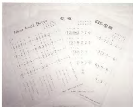
大正琴用楽譜第3期分