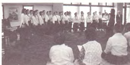
ロビーコンサートの様