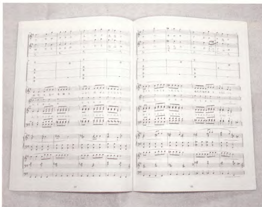
楽譜：上段より雅楽器、調声と同音、讃歌衆、ピアノ、オルガン

おそらく西洋音楽ということで、オペラなどで聴かれるような発声をイメージされていると思われます。しかし、先にも述べましたように、いわゆるクラシック音楽が念頭にあ