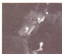
音楽礼拝 「キャンドルの集い」

は「キャンドルの集い」と題して音楽礼拝がつとめられ、満堂の名古屋別院本堂は荘厳な雰囲気。その後、10グループによる演奏と、歌唱指導が行われました。初出演の団体には温かい拍手が贈られ、参加者は仏教讃歌一色の充実した一日を過ごされていました。