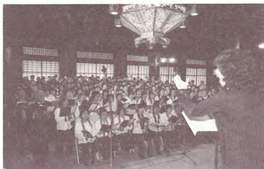
御堂演奏会2009(春)の様

春と秋の2回(計4日間)開催いたしました御堂演奏会2009には、総勢1200名を超えるご参加をいただき、ありがとうございました。