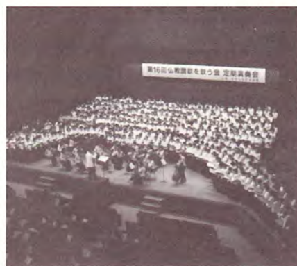
第2部合同演奏の様

また、第2部の合同演奏では、オーケストラの伴奏で、約500人の歌声がホールに響きわたりました。今回の合同演奏にむけては2回の事前練習が行われたとのことで、ステージの熱気が客席まで伝わり、会場の聴衆も一緒に口ずさむ光景が見られました。「歌うよろこびを共に」という主催者の思いがひしひしと伝わってくる演奏会でした。